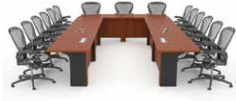
Picha: Mfumo wa ukaaji wa umbo “U”